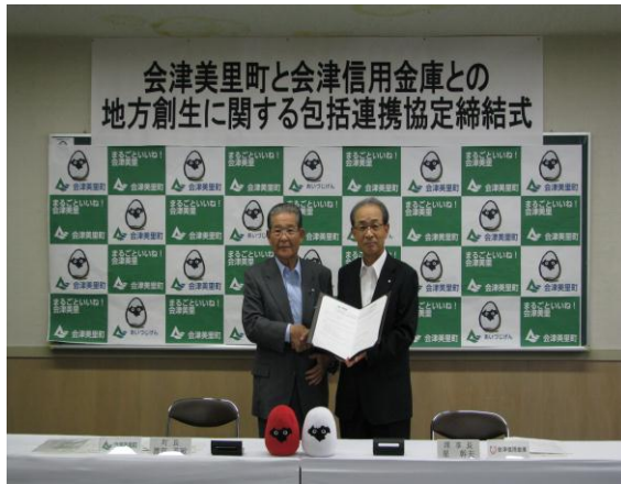
会津美里町(平成 28 年 5 月 27 日)