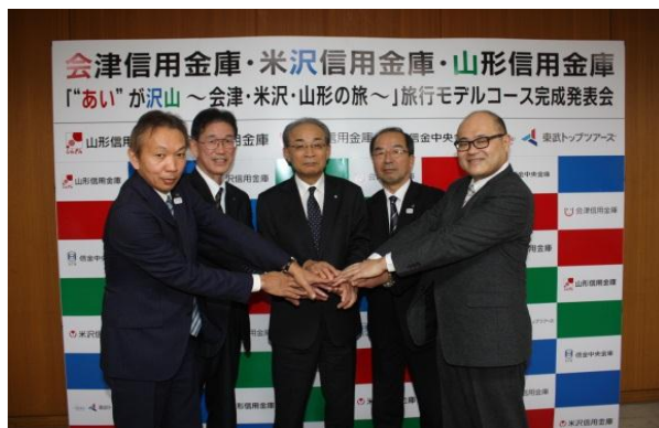
米沢・山形信金と旅行モデルコースを作成 (平成 29 年 1 月 26 日)