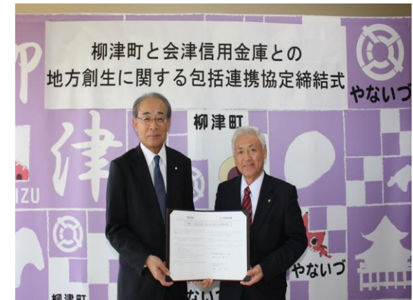
柳津町(平成 28 年 11 月 2 日)