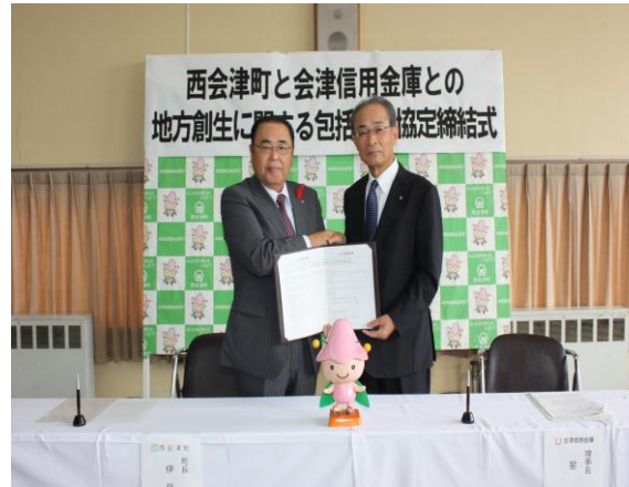
西会津町(平成 28 年 10 月 11 日)