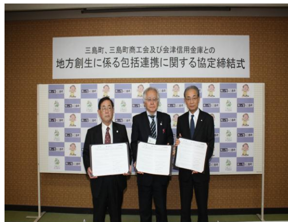
三島町(平成 28 年 12 月 22 日)