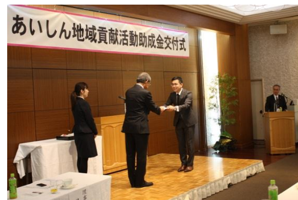
あいしん地域貢献活動助成金交付式 (平成 29 年 3 月 7 日)