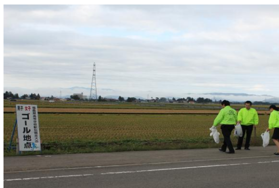
高校駅伝大会コースを清掃 (平成 28 年 10 月 12 日)