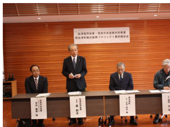
南会津町観光振興プロジェクト報告会の実施