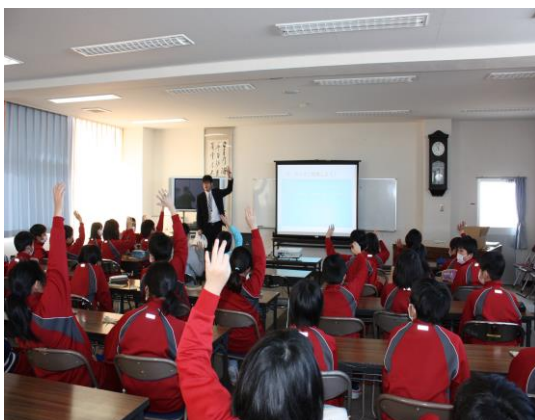
「あいしんマネースクール」の実施