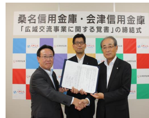
桑名信用金庫との広域交流事業連携