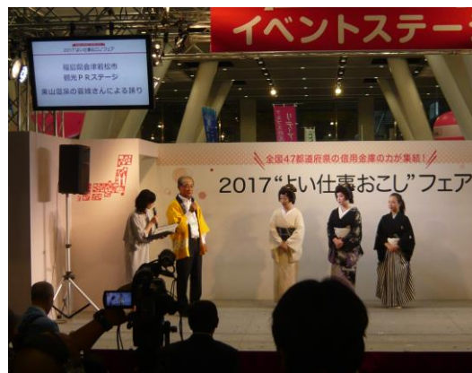
「2017 よい仕事おこしフェア」 への出展