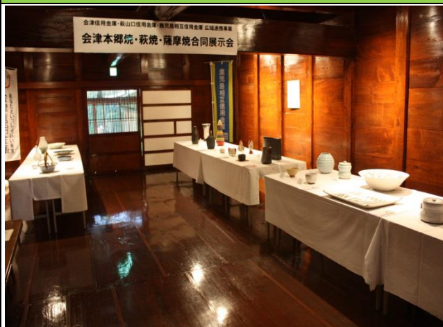
「会津本郷焼・萩焼・薩摩焼」合同展示会