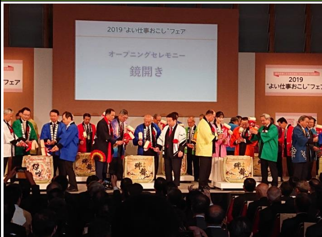
「2019 よい仕事おこしフェア」への出展