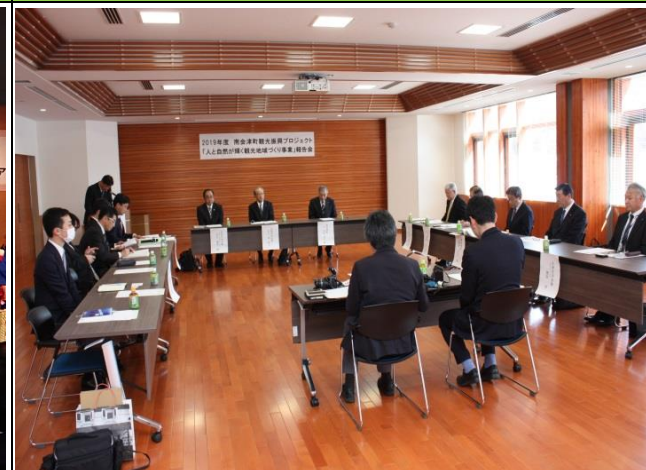
「南会津町観光振興プロジェクト」 報告会