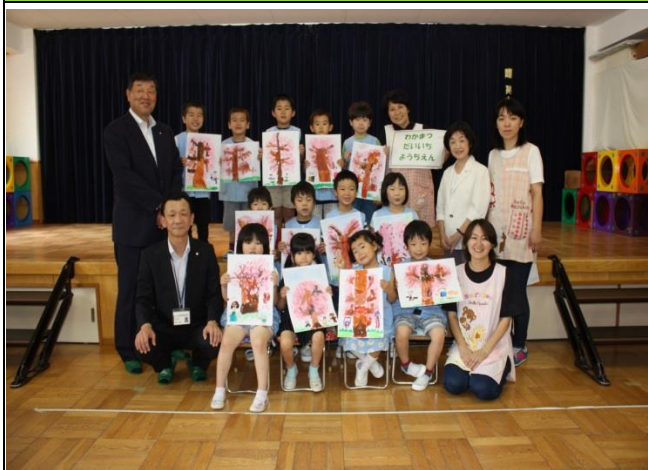
「東北・夢の桜街道運動」 絵画展開催