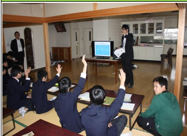
「あいしんマネースクール」開催